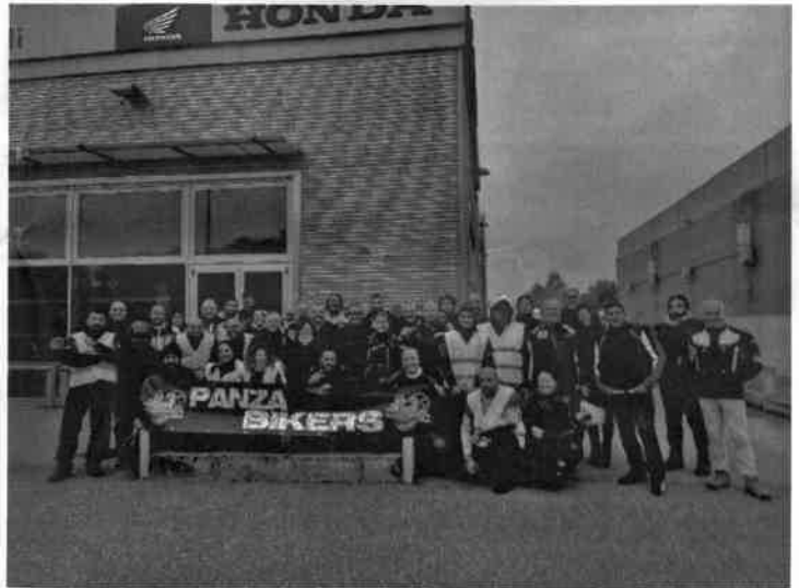
13 ottobre: giro del tavolo a Vico Bagnone (MS)