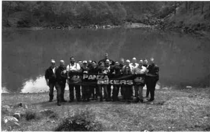
28 Luglio: lago della lame (GE)