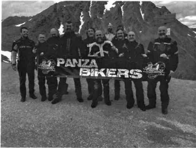
6/7 luglio: Garmisch in Germania

Un'estate intensa per i nostri motociclisti. Tante e partecipate le uscite, eccone qui le principali: