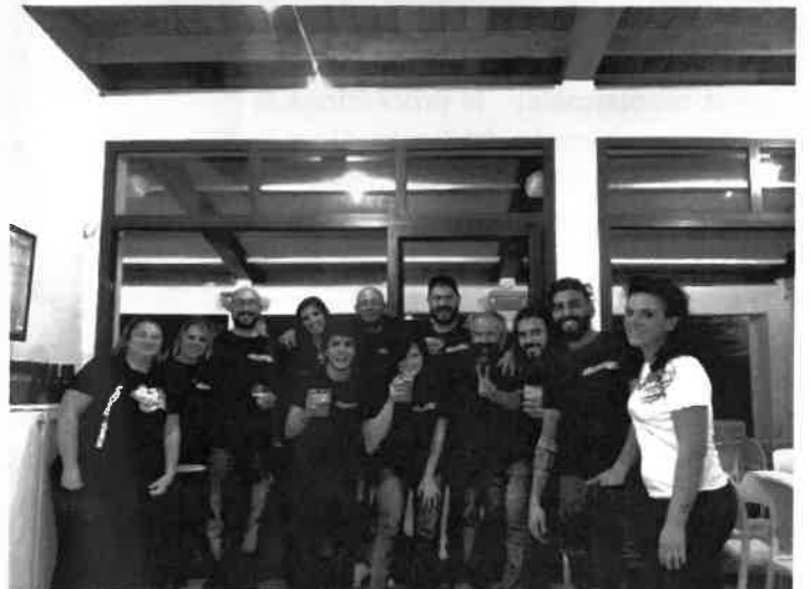
2/3 novembre; "U' desbaratu de noi atri"-Sanremo

CI VEDIAMO TUTTI AL PRANZO DEL 1 DICEMBRE