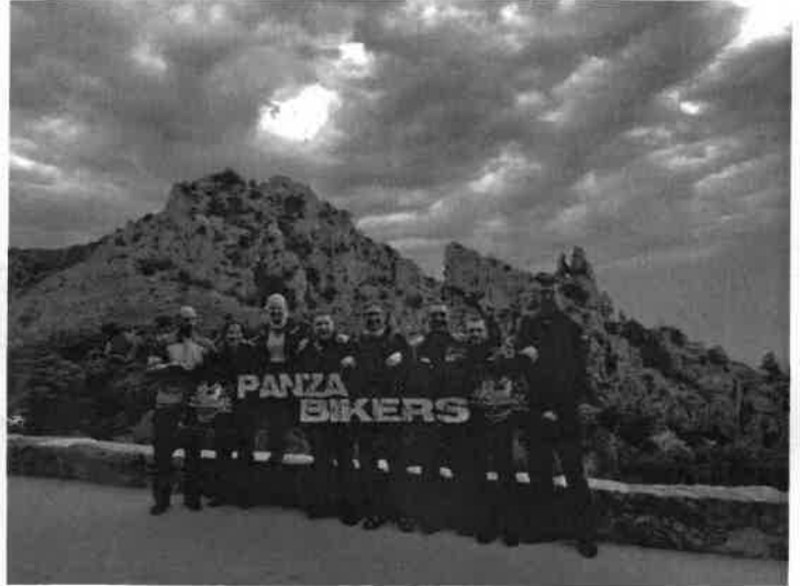
20/22 settembre: Corsica