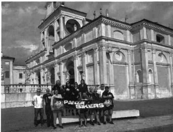
8 Settembre: San Benedetto Po (MN)