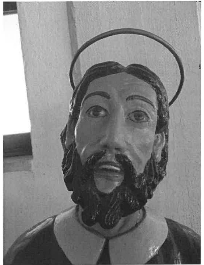
Il volto della statua prima del restauro

Nei giorni appena precedenti il Natale ha fatto ritorno a casa anche la statua di San Rocco di cui ci eravamo accollati l'onere di spesa. Un progetto proposto da noi alla proprietà con il consenso della parrocchia, depositaria della statua. La generosità dei nostri Soci si è contraddistinta anche in questo frangente unitamente al lavoro di tutti i volontari che si sono adoperati nelle varie iniziative finalizzate alla raccolta fondi. La statua ha esattamente 150 anni e nell'anno di questa ricorrenza è tornata alla sua versione originale grazie alla guida della Soprintendenza e alle maestranze della ditta Conservart di Lodi. La patina originale si trovava sotto numerosi strati di vernice e di gesso e l'intervento di restauro è stato più lungo e difficile del previsto per un costo di circa 2500 €. Come si vede dalle foto qui accanto negli anni gli avevano cambiato anche la barba e la pettinatura. Organizzeremo più avanti una serata di spiegazione dell'interessante restauro e abbiamo già messo in cantiere un libro che racconta la storia di San Rocco, del suo culto nella zona e le varie fasi del restauro della statua.