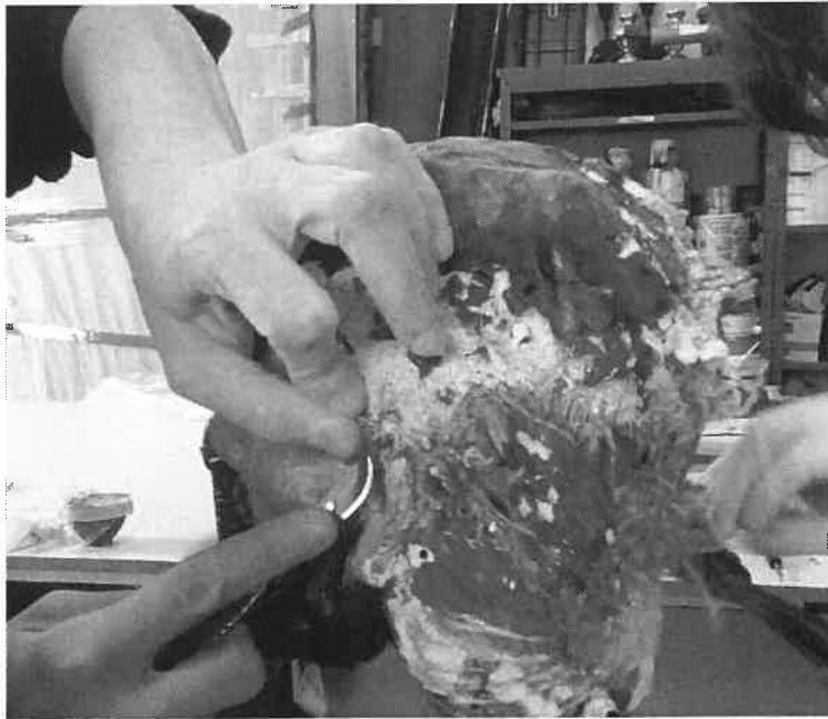
la fase di rimozione della "camottatura" cioè un rivestimento di stoffa e gesso che copriva i "capelli" originali della statua, che non erano di colore nero ma castani.