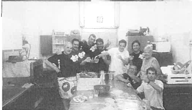
In alto alcuni piatti preparati per il pranzo di San Rocco. qui sopra il generoso gruppo dei cucinieri