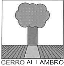
CERRO AL LAMBRO