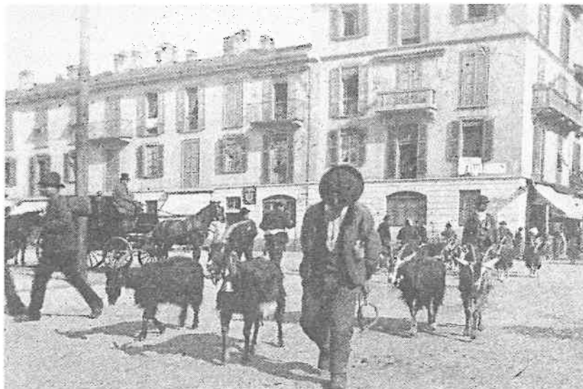
Il capraio in città

Nel frattempo stiamo già preparando la serie di incontri per il 2011 che ci auguriamo possano trovare il favore di sempre più persone