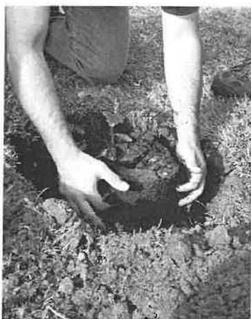
La piantumazione di uno dei cerri fatta il 26 settembre

Un percorso durato un anno. In questo stesso periodo del 2009 alcuni nostri soci si sono cimentati in un'impresa molto particolare quanto incerta: andare a recuperare delle piantine e ghiande di Cerro , quercia che nel nostro territorio non si vede quasi più. Partiti un po' all'avventura nei pressi di Langhirano (PR) dopo una giornata di ricerche (intervallate da un lauto pranzo in trattoria con torta frita, polenta e ottimo vino) portarono a casa un sufficiente numero di ghiande di