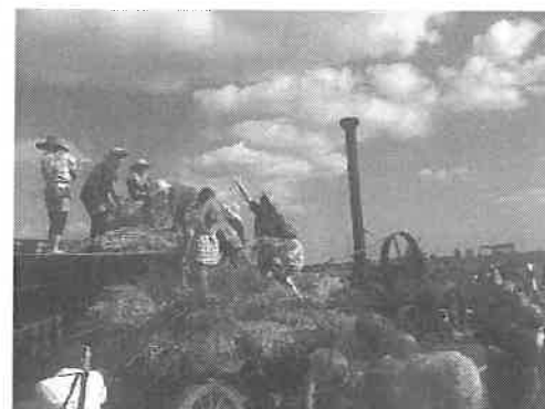
Le "mondine" sulla trebbiatrice e la ciminiera della caldaia che aziona l'antico macchinario

Il 19 settembre, in qualità di coordinatore UNPLI del sud-est Milano ho conosciuto gli amici della Pro Loco di Noviglio che hanno organizzato la 30° edizione della "Sagra della trebbiatura del riso". Nel pomeriggio sfilata di trattori antichi per le vie, preceduta dalle ragazze del paese vestite da mondine che hanno distribuito spighe beneauguranti e vino agli spettatori della sfilata. Al termine sono salite sull'antica trebbiatrice (tutta in legno) dei F.lli Brusati a cui, una possente caldaia a vapore, faceva girare pulegge e ingranaggi, sgranava le spighe separando il riso dalla paglia