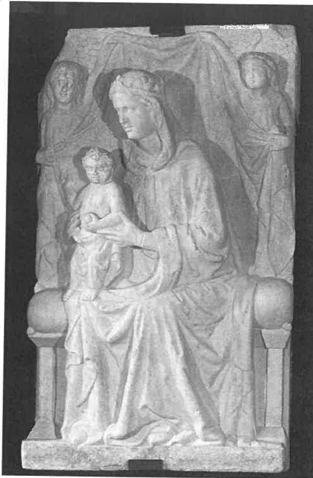
La Madonna dopo il restauro

La sala della presentazione era già strapiena alla sua apertura, sia di autorità (tra cui la nostra amministrazione comunale) sia di milanesi che di curiosi, tant'è vero che il folto gruppo di riozzesi e cerresi arrivati in gruppo o alla spicciolata (più di una quarantina in tutto) sono riusciti a passare a fatica. C'erano i Soci della nostra Pro Loco, Don Antonello con alcuni membri del consiglio Pastorale, il presidente della nostra protezione civile con alcuni volontari e i rappresentanti del gruppo culturale. Il nutrito gruppo ha ascoltato in maniera molto