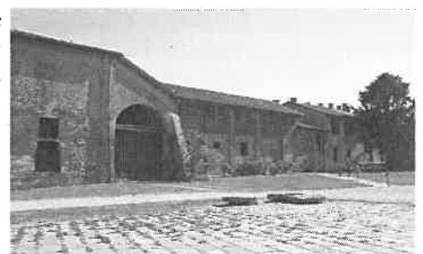
Uno scorcio della Cascina San Romano del Boscoincittà

I fiordalisi si possono seminare anche in questo periodo. Mettiamoli in alcuni vasi e la prossima estate avremo un'esplosione di blu nei nostri cortili!