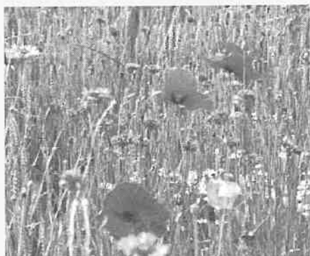
Papaveri e fiordalisi in un campo di grano