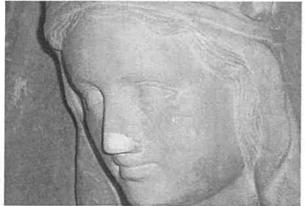
Il volto della Madonna prima del restauro

Il 14 settembre (martedì), alle ore 18 presso il Museo del Castello Sforzesco di Milano ci sarà la presentazione ufficiale alla città del restauro della madonna di Riozzo