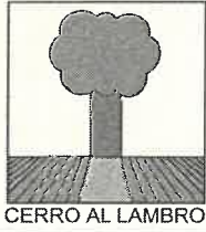
CERRO AL LAMBRO