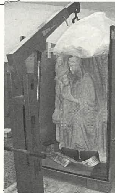
La Madonna al suo arrivo a Firenze

Con un pizzico di orgoglio abbiamo ricevuto i vostri numerosi complimenti per "Fragmenta Historiae", il primo volume de "I quaderni delle Terre di Cerro": il lavoro di preparazione svolto nei mesi precedenti la sua uscita sono stati abbondantemente ripagati dalla vostra soddisfazione; ma al di là della nostra contentezza, se ritenete valido questo nostro prodotto, parlatene, pubblicizzatelo. Spargete la voce che è stato realizzato un libro che parla di noi, fate vedere a chi conoscete ciò che stiamo facendo. Stiamo lavorando per la prossima uscita che, se andrà tutto bene, è nei nostri auspici far uscire in concomitanza con la sagra di Riozzo a fine maggio. Faremo il possibile, come sempre.