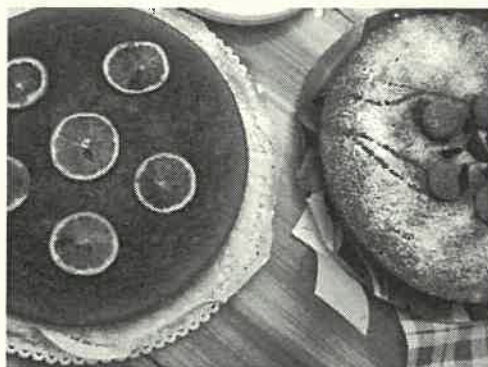
Torte 2008 in gara: sulla dx una vincitrice

L'anno scorso è stato un successo, sinceramente anche noi non pensavamo che avremmo avuto così tanti partecipanti. Quest'anno ne vogliamo ancora di più! Raccogliamo le iscrizioni per la "2° Torta della Sagra" domenica 27 settembre dalle ore 10 alle 12 e dalle 14:30 alle 18. Potrete ritirare il modulo e il regolamento presso il nostro stand che posizioneremo davanti al Centro Civico. Le torte dovranno essere consegnate invece domenica 4 ottobre dalle 10 alle 15 presso il nostro stand; alle 17:45 ci saranno le premiazioni.