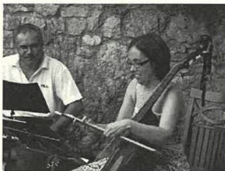
Il duo "Toccati e in fuga"

Lunedì 28 settembre ore 21 al Centro Civico, concerto del duo "Toccati e in Fuga".